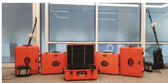
Рисунок 9.4 – Модульные магнитометры GSM-19W (Канада).

Контроль качества съемки будет производиться в специализированном программном обеспечении GEMLink+ и Geosoft Oasis Montaj. Обработка и последующая интерпретация данных производится при помощи Geosoft Oasis Montaj и Geosoft VOXI. Наряду с магнитными данными в формате Geosoft .gdb Заказчику предоставляется отчет по обработке и интерпретации данных магнитной съемки с графическими приложениями и детальным описанием процедур проведения камеральных работ.