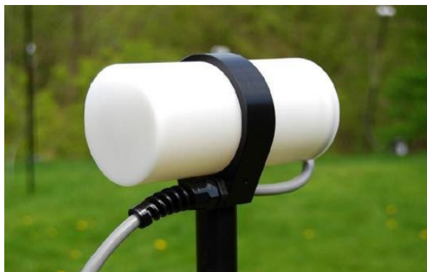
Рисунок 9.1 – Сенсор GSM-19 с обогащёнными свободными радикалами и приемник-регистратор GSM-19

Магнитометры GEM являются технологическим инновационным решением компании GEM Systems (Канада) и объединяют в себе достижения в области электроники и химии квантовой магнитометрии. В корпус датчика помещен запатентованный, обогащенный водородом жидкий раствор в сочетании со свободными электронами (радикалами), добавленными в канадской лаборатории GEM Systems для увеличения интенсивности сигнала под действием высокочастотной поляризации (рис.9.1).