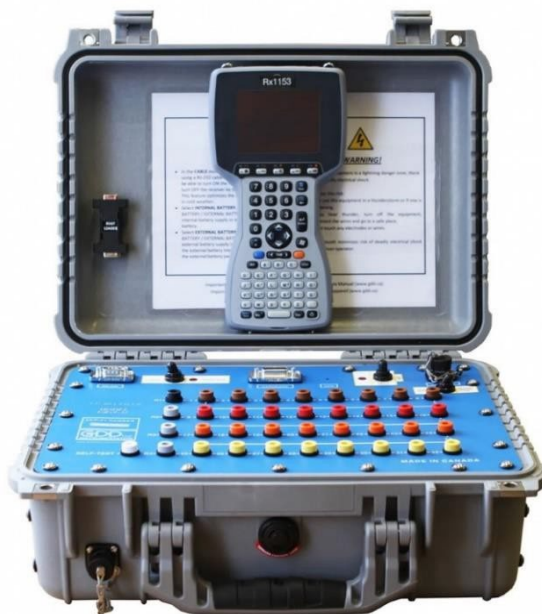
Рисунок 9.5. Измеритель ВП GDD IP GRx8-32

Программное обеспечение измерителей позволяет применять различные установки — поль-поль, поль-диполь, диполь-диполь, а 32-х канальный прибор позволяет реализовать не только линейную (на 32 электрода), но также 2D и 3D расстановки (2 профиля по 16 или 4 профиля по 8 электродов). Использование настроек 20-ти программируемых окон измерения, позволяет детально анализировать кривые спада поляризации. На экран КПК выводится график измерения, значения переходного сопротивления заземлённых электродов, уровень шума, напряжение пропускания, кривая спада ВП, значения кажущегося сопротивления и поляризуемости.