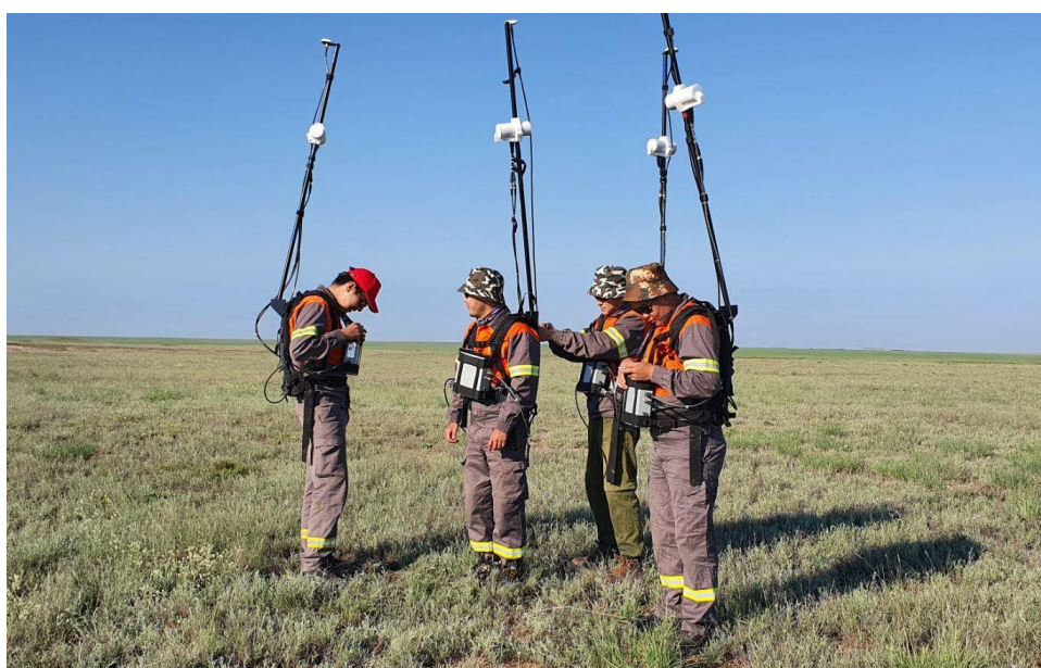
Рисунок 9.3 – Выполнение наземной магниторазведки с помощью модульного магнитометра GSM-19W (Канада)

По сравнению с методами протонной прецессии, обеспечение радиосигнала потребляет электроэнергию на минимальном уровне. Сигналы радиочастоты не попадают в частотный диапазон прецессионного сигнала и не снижают чувствительность, т.е., измерение поляризации и уровня сигнала может происходить одновременно – это позволяет производить измерения непрерывно с большей скоростью, а также уменьшает периодичность (т.е., увеличивает скорость взятия замеров). Благодаря этому, измерения производятся не традиционным методом замера по точкам, а в режиме непрерывной съемки, что в свою очередь в разы увеличивает разрешение, качество магнитометрических измерений и их плотность (рис.9.2).