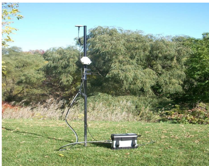
Рисунок 9.2 – Магнитовариационная станция

подходит для измерения полной напряженности магнитного поля с очень высокой чувствительностью.