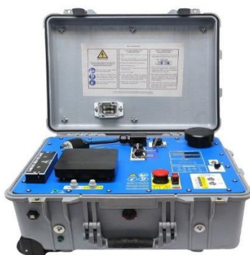
Рисунок 9.6. Электроразведочный передатчик GDD Tx4

При замере на каждой точке (пикете) профиля передатчик вырабатывает первичные прямоугольные импульсы тока частотой 1/8 Гц, а приёмники производят регистрацию спада потенциалов ВП после достижения синхронизации с передатчиком. Потенциалы для вычисления сопротивлений измеряются в рабочем интервале передаваемого токового импульса, а спад потенциалов ВП по кривой разряда измеряется в промежутке между импульсами тока. Ресивер (приемник) осуществляет регистрацию кривой спада потенциала ВП по 20 временным окнам, распределенным в течение рабочего интервала длительностью 2000 мсек. Регистрация начинается через 40 мсек после выключения питающего тока трансмиттера.